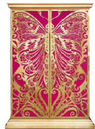
Armoire Mademoiselle de Koket